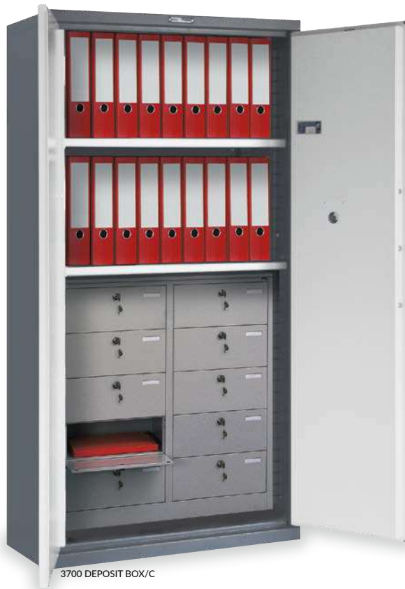
3700 DEPOSIT BOX/C

ARMADI BLINDATI SECURITY CABINETS ARMOIRES FORTES SCHRÄNKE ZUR AUFBEWAHRUNG ARMARIOS REFORZADOS