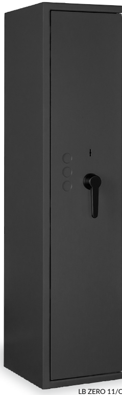
LB ZERO 11/C