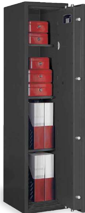
LB ZERO 11/C